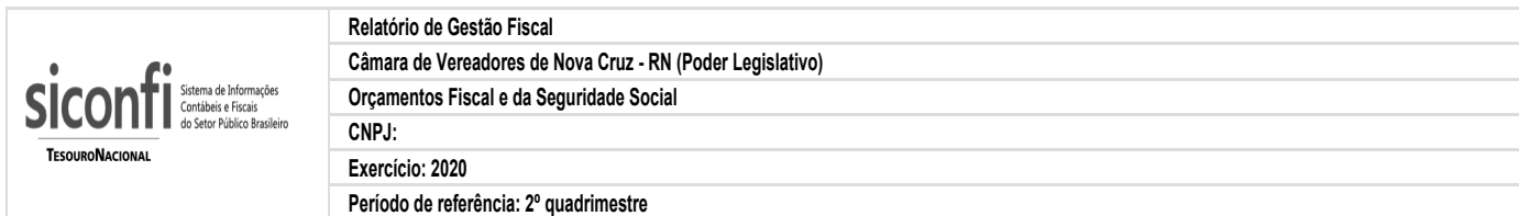
RGF-Anexo 01 | Tabela 1.0 - Demonstrativo da Despesa com Pessoal