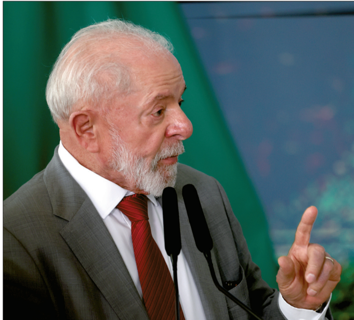
Lula tem a desaprovação de 49% dos brasileiros. 47% aprovam

A aprovação do governo do presidente Luiz Inácio Lula da Silva (PT) caiu cinco pontos percentuais em janeiro deste ano, atingindo 47%, de acordo com pesquisa Genial/Quaest divulgada na segunda-feira (27). É a primeira vez que o índice de desaprovação supera a aprovação na série histórica, iniciada em fevereiro de 2023.