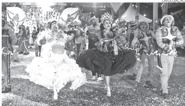
Edital prevê fomento a quadrilhas tradicionais e estilizadas; seis projetos serão beneficiados

A Prefeitura de São Gonçalo do Amarante, por meio da Fundação Cultural Dona Militana (FCDM), lançou um chamamento público de apoio às quadrilhas juninas do município. As inscrições para concorrer ao patrocínio financeiro estão abertas até o dia 26 de maio. Serão investidos R$ 58 mil no fomento à cultura do município. O edital está dividido nas seguintes categorias: quadrilhas tradicionais e estilizadas com até 10 anos e quadrilhas tradicionais e estilizadas com mais